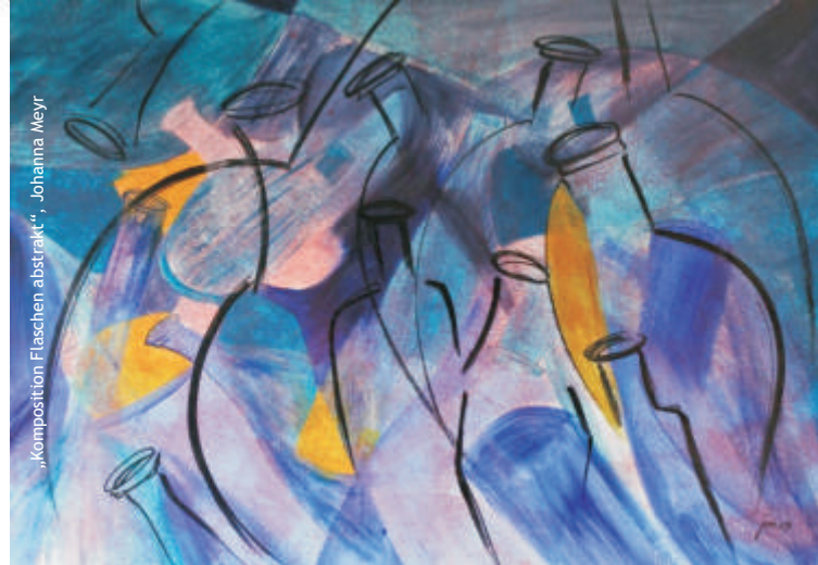
„Komposition Flaschen abstrakt“, Johanna Meyr